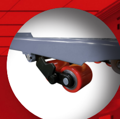
Roues boggies en polyuréthane montées sur roulement à billes pour une meilleure stabilité