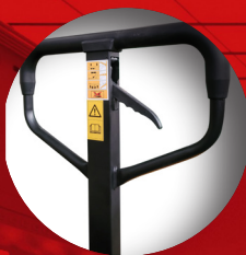
Pompe rapide avec réservoir intégré