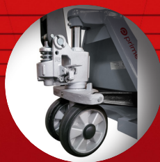
Roues directrices en aluminium avec bandage caoutchouc